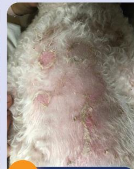
4 Oberflächliche Pyodermie