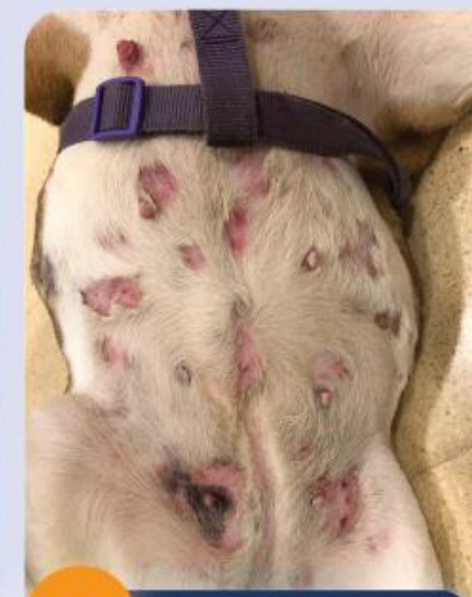
2 Oberflächliche Pyodermie