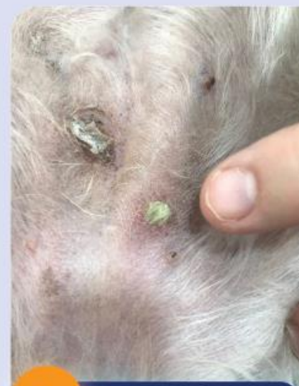
1 Oberflächliche Pyodermie