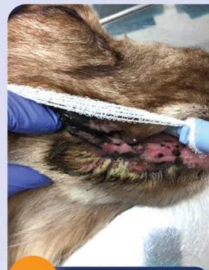
3 Oberflächliche Pyodermie